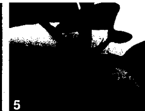
5 Nécrose apicale. Les bourgeons apicaux sont détruits et ne pourront donner de nouvelles pousses ou inflorescences.