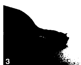
3 Nécrose à la base de la feuille et chancres sur le pétiole.