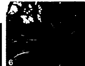
6 Nécroses développées et chancres sur un rameau qui a perdu la plupart de ses feuilles actives.