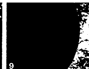
9 Dégâts sur fruits

Sur les branches, rameaux, et pédoncules : la bactérie provoque des taches en relief et des craquelures et chancres. Après avoir pénétré dans les jeunes tiges, elle survit à l'intérieur de ces organes en saison sèche. De la gomme contenant des bactéries exsude des chancres, surtout en saison des pluies. Ces chancres peuvent fragiliser les charpentières et les rendre vulnérables aux vents violents.