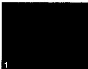
1 Taches à la face inférieure d'une feuille. Les taches noires sont entourées d'un halo plus clair, huileux.

Sur les feuilles : les dégâts commencent par de petites taches huileuses qui évoluent en taches nécrotiques noires, anguleuses, en relief, souvent limitées par les nervures de la feuille. Ces taches noires sont entourées d'un halo plus clair d'aspect huileux à la face inférieure, et d'un halo jaune à la face supérieure. Sur les pétioles et la nervure principale, on note la présence de chancres. Les feuilles fortement attaquées tombent et l'on observe alors de longs rameaux défoliés.