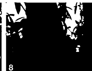
8 Cratères sur une branche. La gomme contenant des bactéries s'écoule de ces plaies surtout avec le retour des pluies.