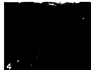
4 Chancres sur rameaux avec écoulement gommeux.