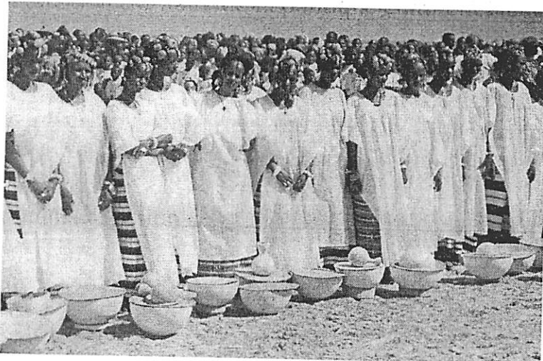
Le Yaaral à Dialloubé.

(a) sur le plan national : des actions concrètes favorisant des relations positives d'échange et d'enrichissement mutuel entre les différentes aires culturelles du pays doivent être encouragées.