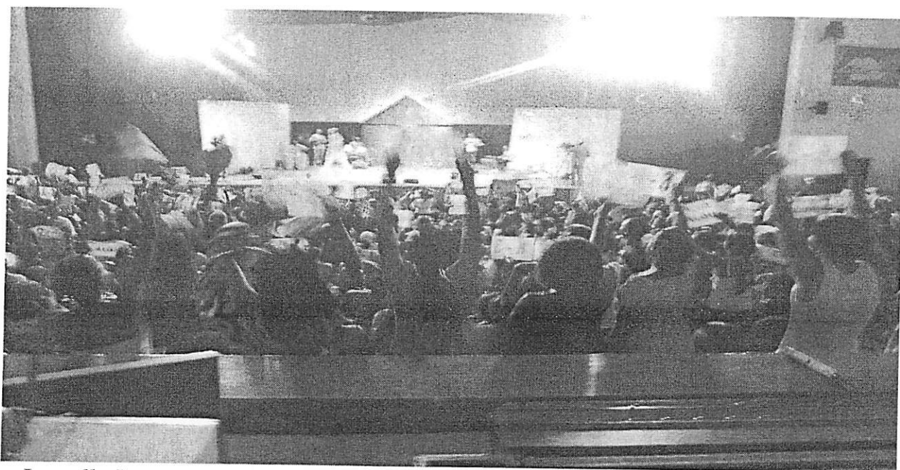
La salle Bazoumana Sissoko du Palais de la Culture Amadou Hampaté BA lors d'une émission de télé-réalité