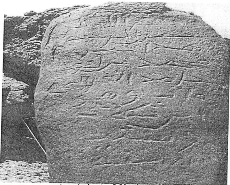
Gravure rupestre